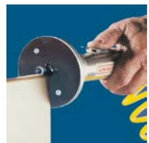
Abrunden von Umleimern an Ecken und Kanten.